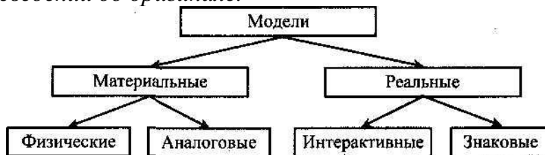
Рис. 1. Классификация моделей

Модель — это материальный или идеальный объект, заменяющий оригинал, наделенный основными характеристиками (чертами) оригинала и предназначенный для проведения некоторых действий над ним с целью получения новых сведений об оригинале.